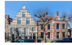
Voorstraat 12 Voorschoten

Opdrachtgever : Gemeente Voorschoten Object : Ambachts- en Baljuwhuis Adres : Voorstraat 12 Voorschoten Bouwjaar: 1635 / 1982 Omvang: ca. 900 m2 BVO Periode : 2024 - 2038 Bedragen : Exclusief BTW Prijspeil: 2023 Datum : 31 mei 2023